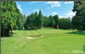
アプローチ練習場