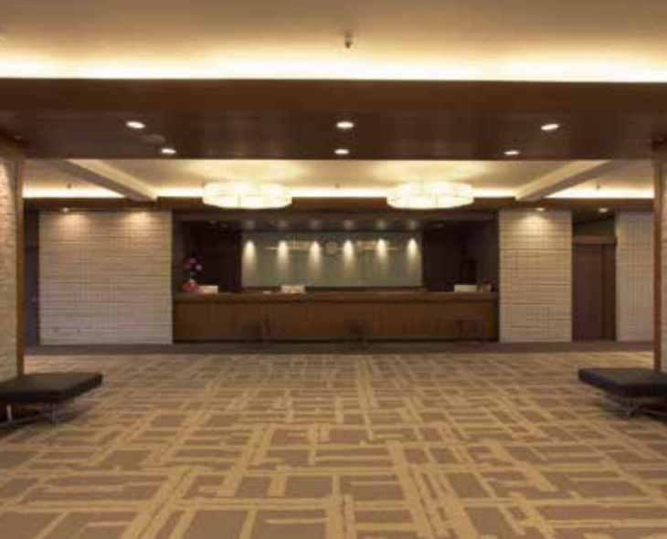
落ち着きと安らぎを感じる風格漂うクラブハウス