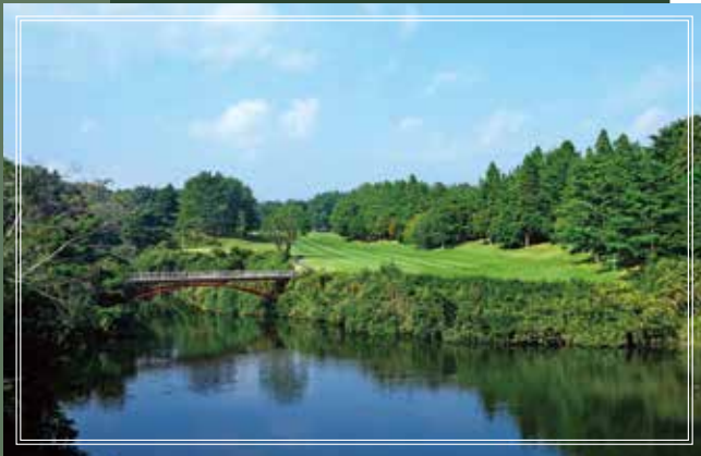
West course No.17 465yards par4

フェアウェイ中央の大樹により攻め方が分かれ、トーナメントでも数多くのドラマを生んだ名物ホールです。