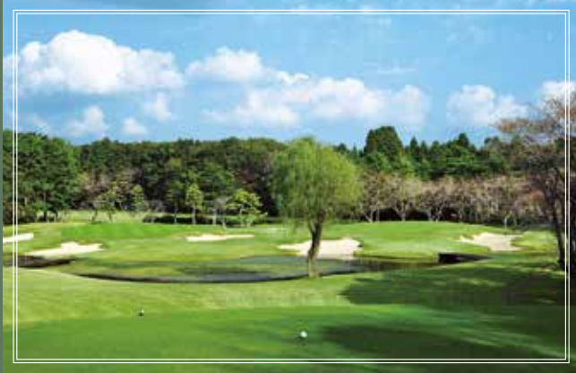
East course No.4 165yards par3

日本で初めてビーチバンカーを取り入れ、池の中にグリーンが浮かぶ美しいホールです。