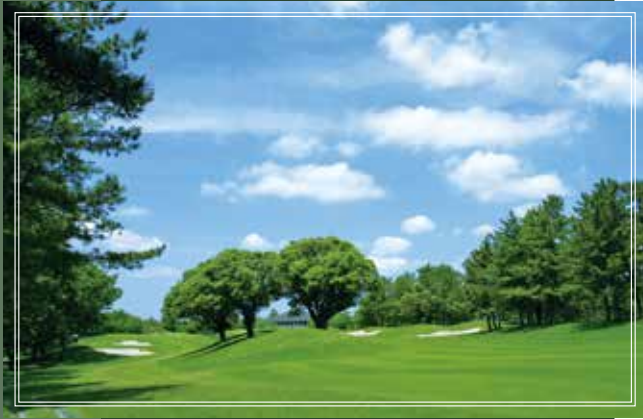
East course No.18 405yards par4

日本で初めてビーチバンカーを取り入れ、池の中にグリーンが浮かぶ美しいホールです。