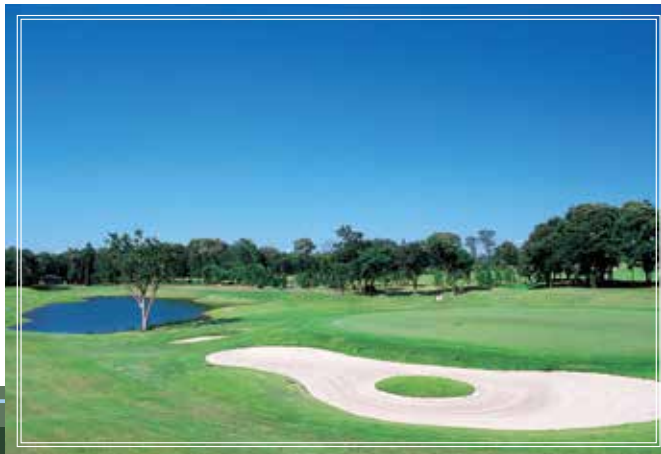
in course No.15 縦長に伸びる池が手前まで迫る、距離のあるパー3 228yards par3