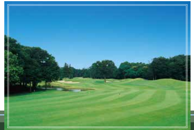
in course No.16 セカンドの距離感が決め手となる砲台グリーンのパールパー4 423yards par4