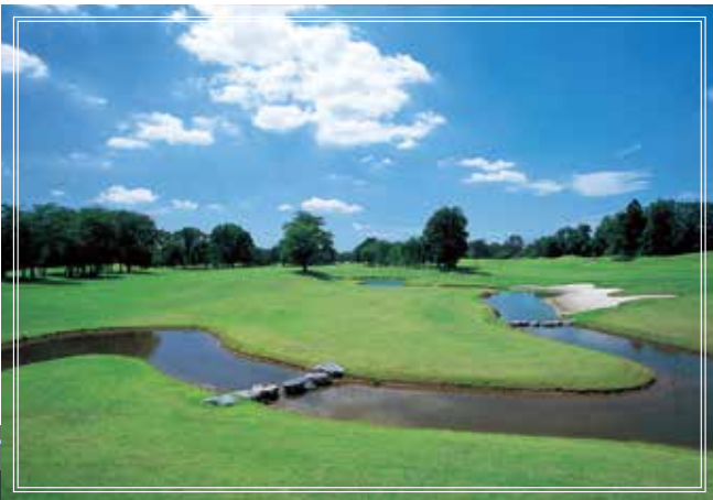
out course No.6 クリークを気にせず、ダイレクトなティーショットを飛ばしたい開放感溢れるパー5 514yards par5

JGTOチャレンジトーナメントとは、ジャパンゴルフツアーのセカンドツアーとして若手ゴルファーの育成を趣旨に毎年開催される(社)日本ゴルフツアー機構主管のプロゴルフ公式競技。歴代優勝者には、現在ツアートーナメントで活躍中の有名選手が数多く名を連ねています。