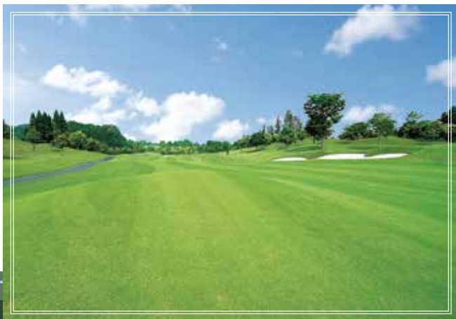
East course No.9 ティーショットは左側が狙い目。一見広く見えるが、第2打日以降グリーン左手前はOBが浅く、油断は禁物。ピンポジションによっては難易度が大きく変わり、慎重なパッティングが必要となる。 556yards par5

●名称/大多喜城ゴルフ倶楽部 ●所在地/千葉県夷隅郡大多喜町上原 1090 ●コース/27ホール、パー108、全長10,372ヤード ●コースレート/〈東⇒中〉BT:71.2 RT:69.0 〈中⇒西〉BT:71.3 RT:68.8 〈西⇒東〉BT:70.8 RT:68.9 ●コース設計/ゲーリー・プレーヤー、金田武明 ●事業主/㈱大多喜城ゴルフ倶楽部(東急不動産グループ) ●運営/東急リゾート&ステイ(株) ●開業/平成4年12月1日