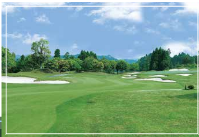
Center course No.7 ティーショットは右OBに気を付ければ比較的楽に狙えるロングホール。2オンを狙うとフェアウェイも狭い上に、グリーン周りにバンカーが多いので注意が必要。 603yards par5