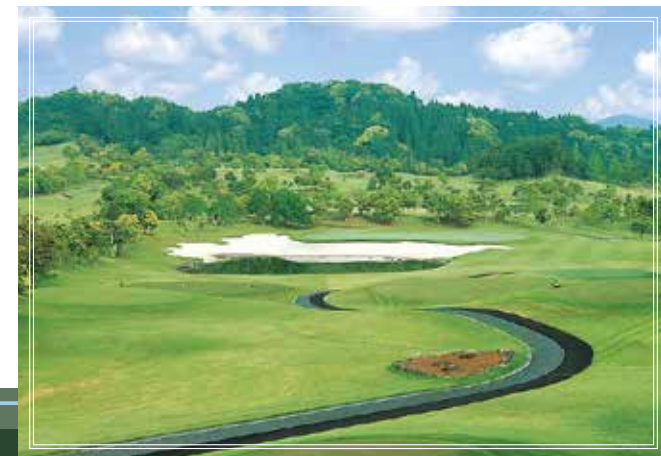
West course No.6 ロケーションのいい池越えでやや打ち下ろしのショートホール。グリーン手前の大きく開いた池とピンバンカーにプレッシャーがかかる。グリーン奥は狭く正確なショットが必要。 205yards par3