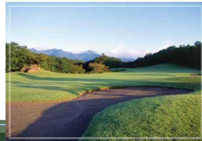
out course No.9 背景に那須連山を有した名物の谷超えホール。 350yards 前方に見える巨石を目標に果敢に攻めたい。 par4