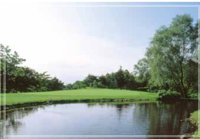
in course No.12 グリーン手前にウォーターハザードが配された 153yards 打ち下ろしの美しいショートホール。 par3 的確なクラブ選択とショットでピンを狙いたい。