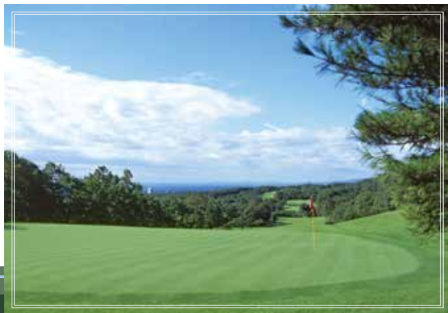
out course No.2 那須国際CCの中で要注意のホール。 334yards 微妙なアンジュレーションと高速グリーンを par4 臨みきることが、スコアメイクの鍵。