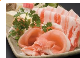
アグー豚 しゃぶしゃぶ