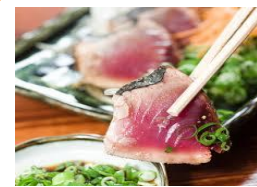
鹿児島産 鯉のタタキ