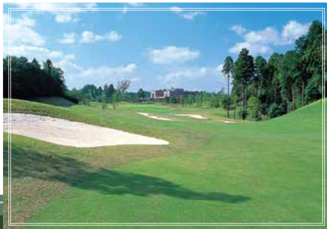
out course No.9 476yards par5 バンカーやマウンドがフェアウェイを挟みつけるように配置されており、パーディーチャンスを手に入れるためには正確なショットが要求されます。