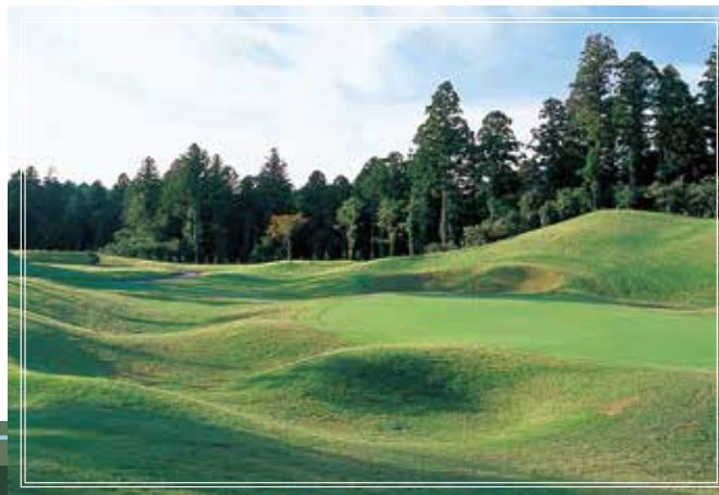
in course No.16 167yards par3 ストレートに伸びたショートホールはのびのびとティーショットできるコースの1つです。