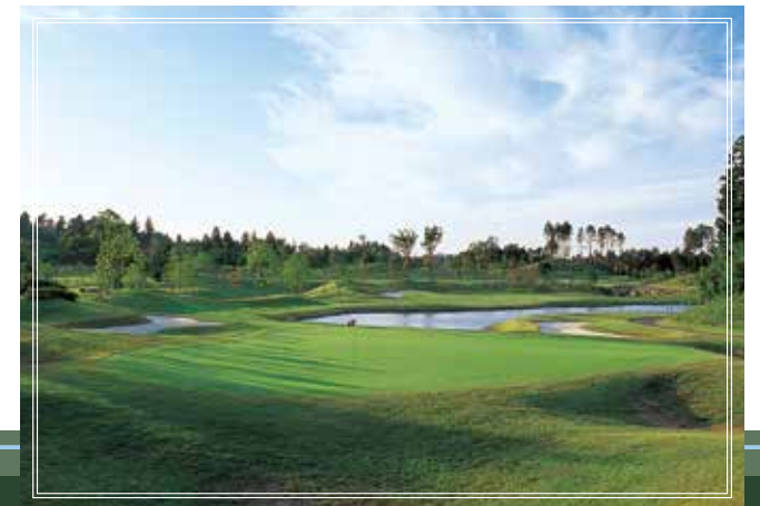
in course No.18 371yards par4 フェアウェイは左側が池、右側が大きなクロスバンカーに囲まれており、ティーショットもセカンドショットも池越えとなるスリリングで美しいホールです。