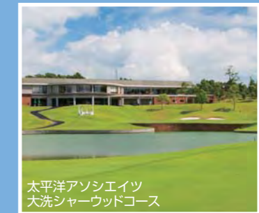
太平洋アソシエイツ 大洗シャーウッドコース