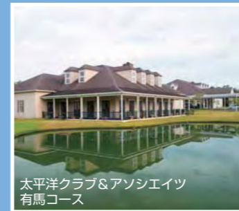
太平洋クラブ&アソシエイツ 有馬コース