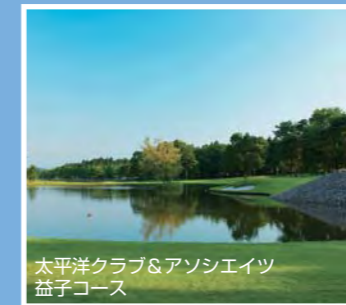
太平洋クラブ&アソシエイツ 益子コース