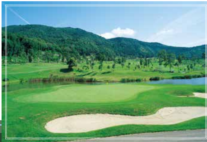
out course No.2 177yards par3

名物ホールの一つ。 セカンドはクリーク越えのミドルホール。 正確なショットと飛距離が要求される。