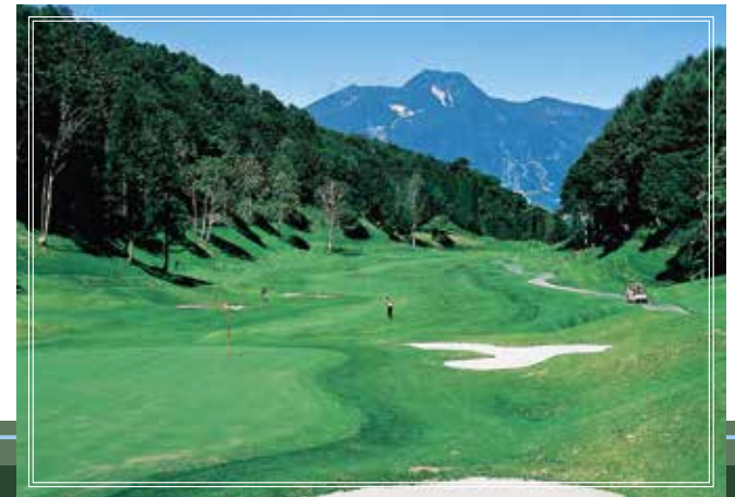
in course No.16 511yards par5

日本百名山の一つ妙高山を背にしたロングホール。 ゆるい打ち上げで距離もあるので 思いっきり攻めたい。