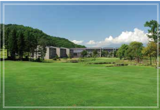
out course No.9 420yards par4

「2サム歓迎」、「ゴルフナビ付乗用カート」、「計338室のホテルと直結」などカジュアルでリゾート気分を満喫できる斑尾東急ゴルフクラブでのプレーをお楽しみください。