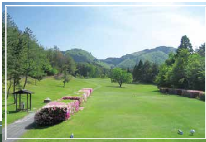
out course No.8 442yards par4 距離のあるタブなミドルホール。最短ルートは左側だがOBラインが浅いので注意。グリーン右手前のバンカーには要注意。