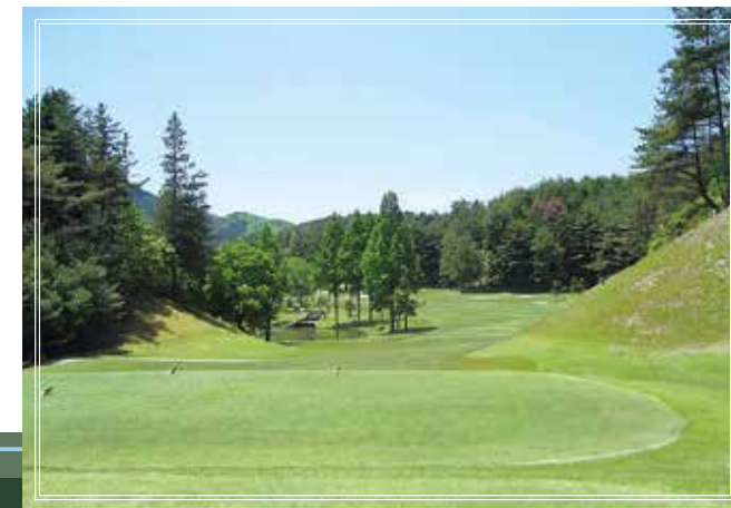
in course No.17 331yards par4 左側に大きなメタセコイヤがあり、グリーン方向には打ちにくい。安全に右サイド狙い。