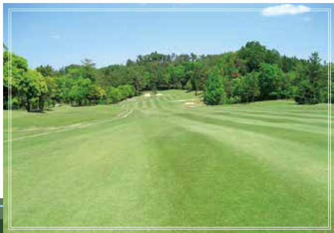
out course No.1 515yards par5 やや打ち下ろしのロングホール。2打目は、左の林に注意。